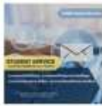
ระบบหนังสือศึกษา