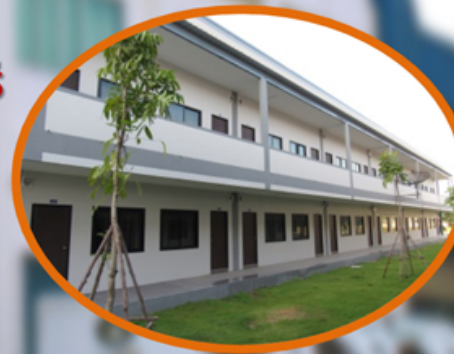
บ้านพักฟรี