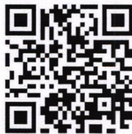
QR code 2

เว็บไซต์กองวิเทศสัมพันธ์ มหาวิทยาลัยเกษตรศาสตร์