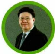
รศ.ดร.สมภพ มานะรังสรรค์ อธิการบดีสถาบันการจัดการปัญญาภิวัฒน์